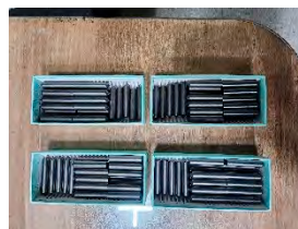
<Steel Stylus Pin>