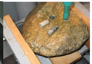
<암석 Vise 옵션>