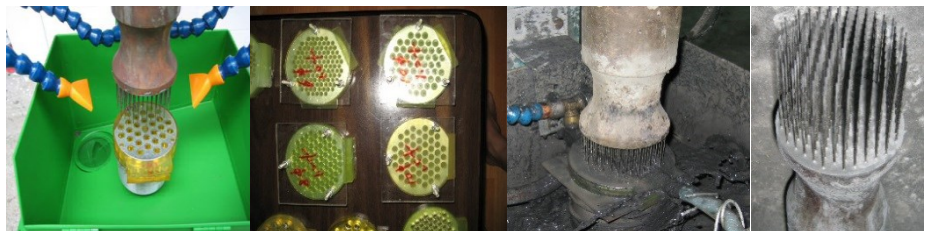
<몰드 및 헤드>