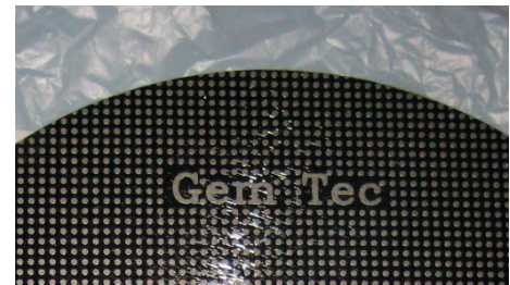
<Merits of Dot Type, As Compared with the Conventional Type>