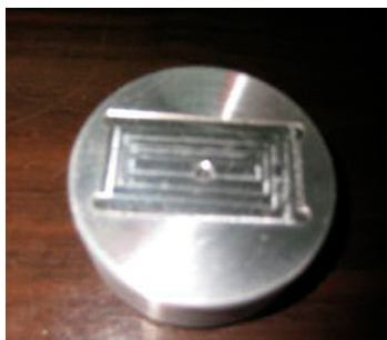
<Dot Type Diamond Disc>